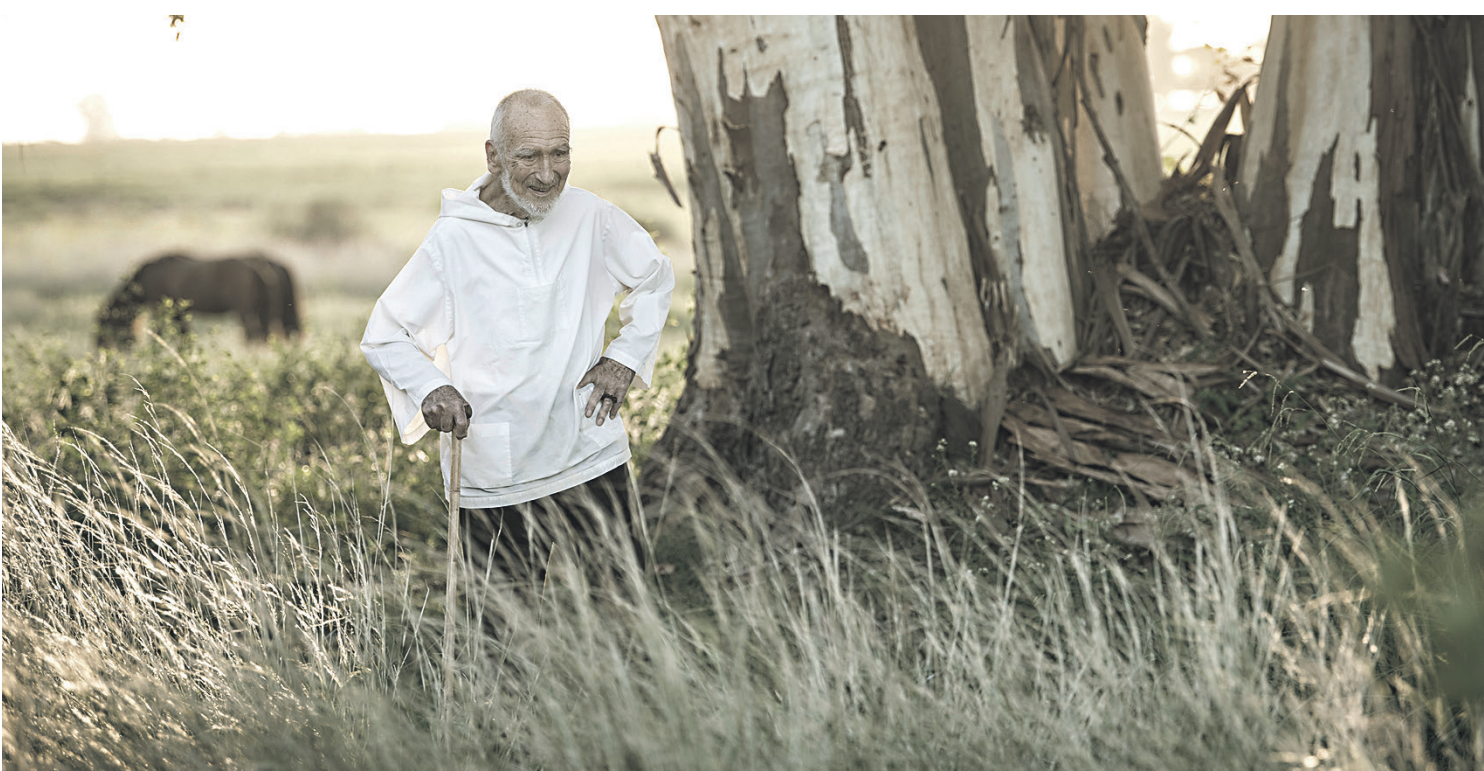
Benediktinermönch David Steindl-Rast wird am 12. Juli 95 Jahre alt.

notwendig, die zunehmende Unabhängigkeit und erlangte Freiheit der Menschen mit einer „Verbundenheit mit Menschen, Tieren und allen Lebewesen“ zu kombinieren. „Wir müssen uns wieder eingebettet wissen und danach handeln.“ Die Corona-Krise und „das Elend dieser Welt“ könnten nur gemeinsam gelöst werden, durch eine engere Zusammenarbeit innerhalb der Weltgemeinschaft.