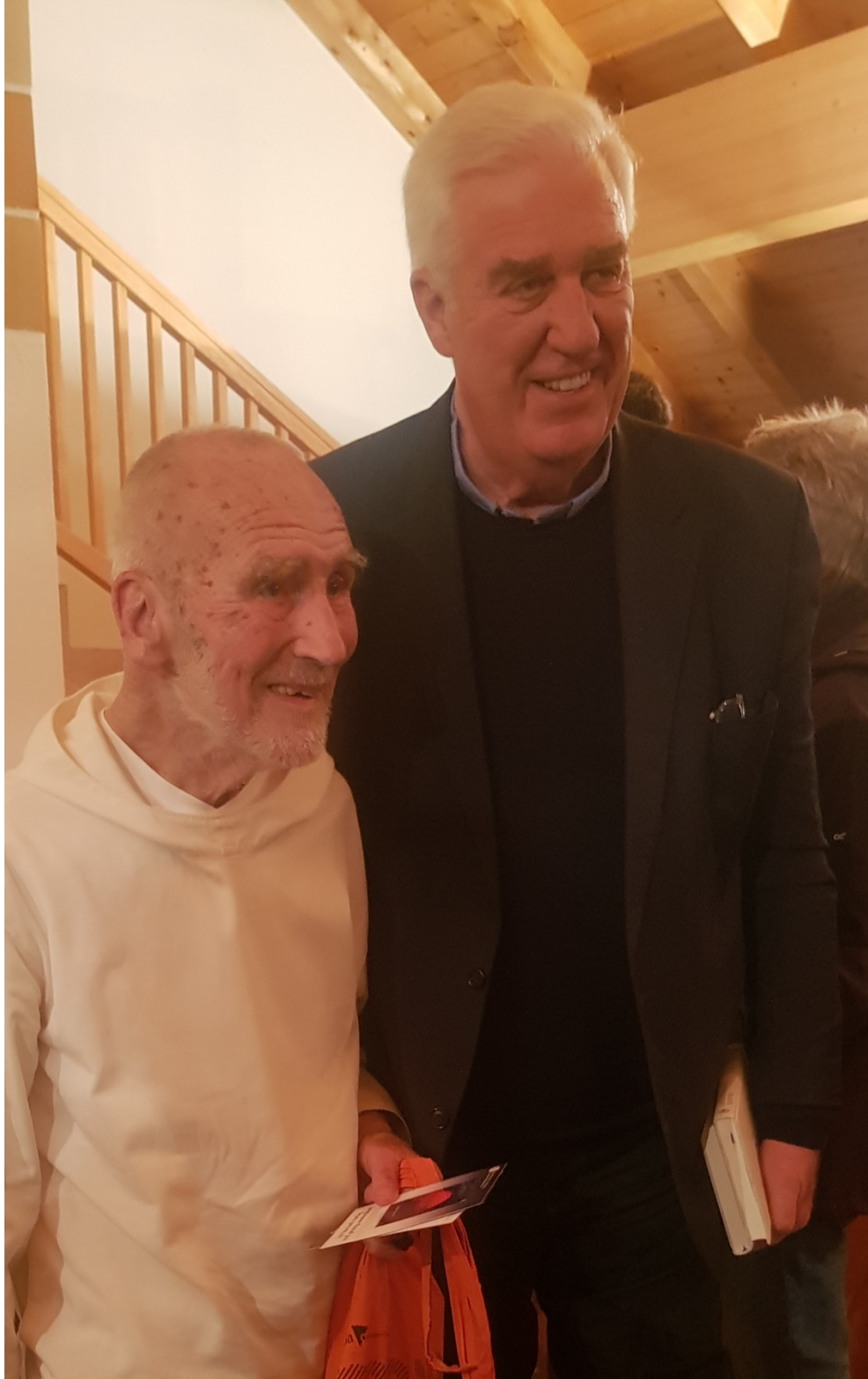
EUROPAKLOSTER – St. Gilgen am Wolfgangsee Donnerstag, 4. April 2024